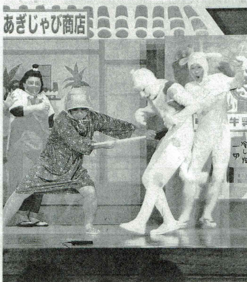
を捨てないよう呼び掛けた=11日、大宜味ター

一方、残された人を前進させるには、日頃の語り掛けが重要と指摘。「愛する人たちに何を語り、何を残し、何をなすべきかを考え、今日から伝えてほしい」と