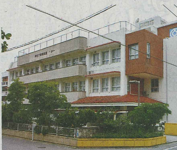
12月4日に竹富町教育委員会が入居する石垣市IT事業支援センター。24日午後、石垣市新栄町

町は石垣支所建設地の選定資料を基に、▽250平方メートル以上のスペース▽石垣港離島ターミナルから徒歩5分、半径500メートル以内▽業務に支障がない設備機能一を条件に移転先の選定作業を進めていた。